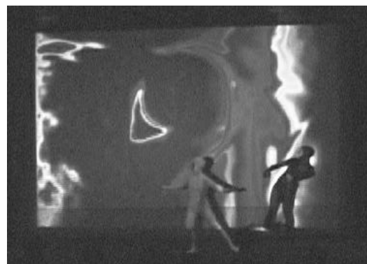
図1 図と地のある映像と身体の関係付け (cell/66b Test-patches より “Liquid Dream”)

は確立されていない。身体運動と映像と関係付けの一つの基準として、筆者が Multimedia Performance Unit cell/66b と、パフォーマンスの身体運動を映像・音楽に直接反映させるデバイスシステムを開発し、それを利用して作品を制作してきた経験から、デバイスのデモンストレーションにならない、観客のイメージを引き出すような解釈の余地を残した身体運動・映像の関係付けが重要であると考えられる[5]。詳細は文献[5]にあるが、図1にあるような図と地のある映像では身体運動と映像の空間的關係(腕の動きと映像の動きの方向等)を一致させる一方で、運動と映像の動きに時間的にずれを生じさせるような演出が効果的であり、また、図2のような地のみの映像では、時間的關係を一致させる一方で、身体と映像の空間的対応付けは必ずしも一致させなくても(例えば、身体の運動方向と映像の移動方向が一致していなくても)効果的な演出が可能であると考えられる。